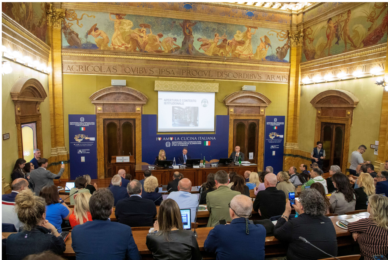
La storica visita del Ministro Francesco Lollobrigida e l'approvazione del bilancio 2025.